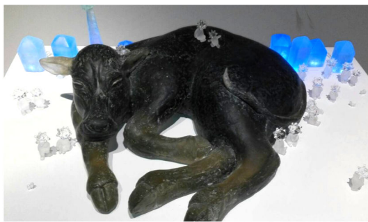
ギャラクシー☆mow-mow 渡辺小麦 作