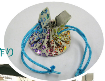
皮革工芸体験 かんたんかわいい巾着作り